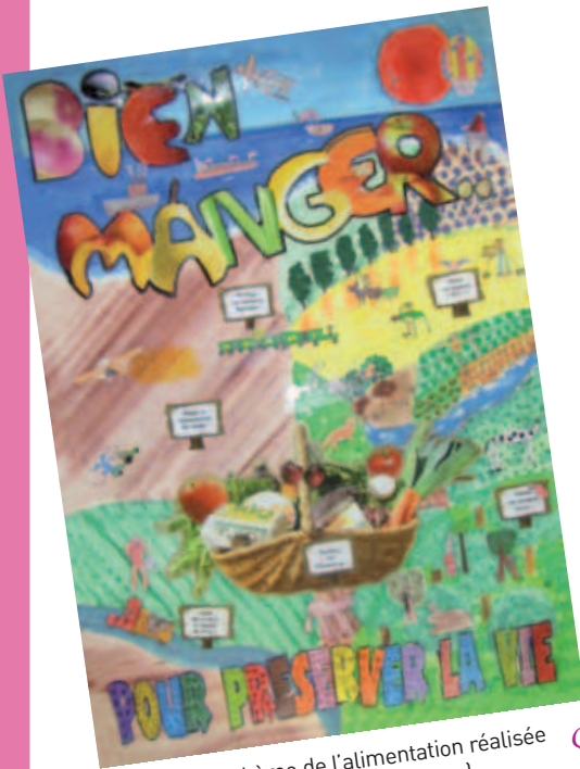
Affiche sur le thème de l'alimentation réalisée par l'école du Bout du Monde (Drôme).

Découvrez d'autres éco-codes dans la rubrique « téléchargements » du site Internet Eco-Ecole.