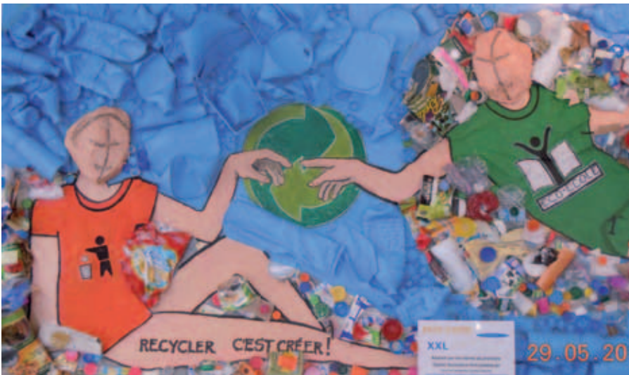
Fresque sur le thème des déchets réalisée par le lycée Louis Barthou (Pyrénées Atlantiques).